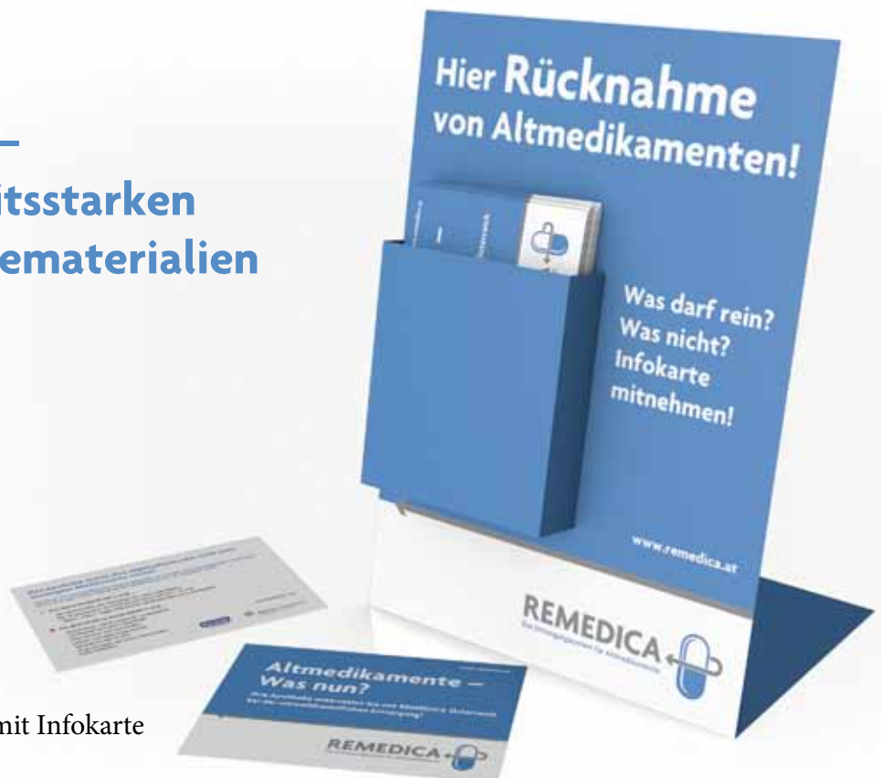
Thekendisplay mit Infokarte