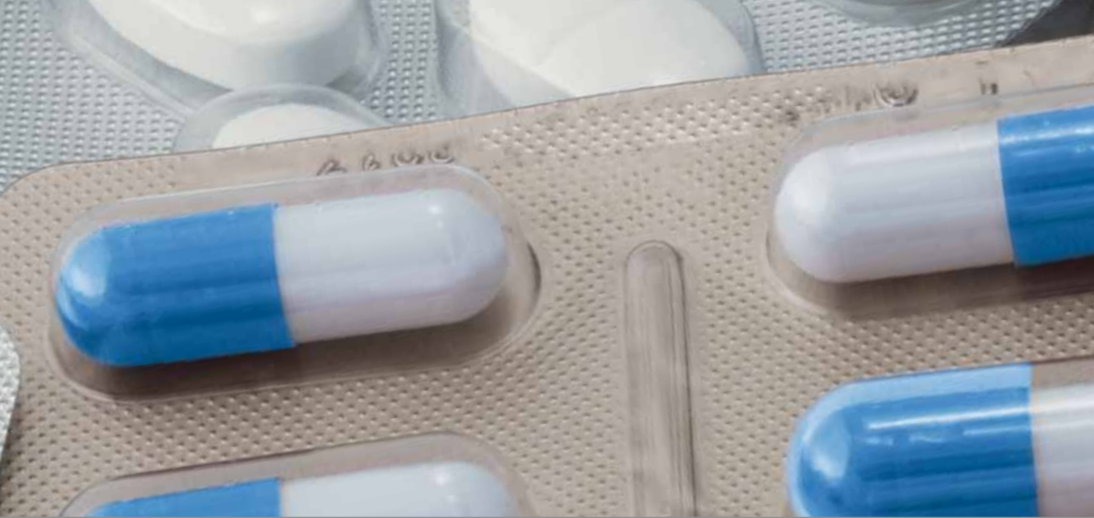
Infokarte zur richtigen Sammlung von Altmedikamenten